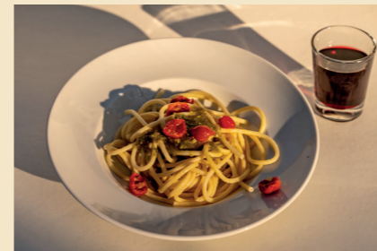
50 WO BERLIN NACH ITALIEN SCHMECKT Zum Beispiel bei Viani in Schöneberg