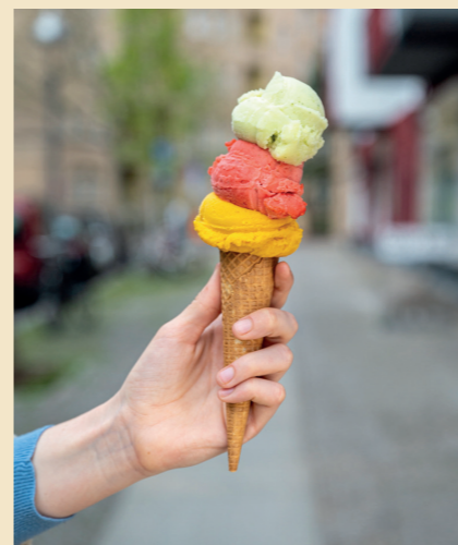
56 EISLÄDEN Gimme Gelato in Berlin Charlottenburg: Unsere tägliche Tüte