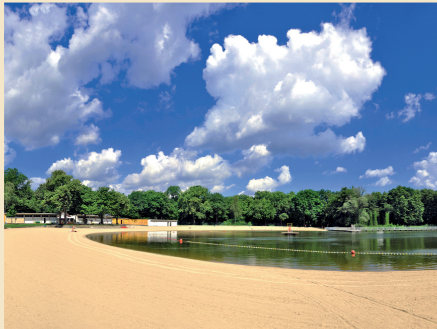
18 BEST OF BADEN Saubere Sache: das Freibad Jungferheide

60 Service: Mehr Gastro Streedfoodglück, Reishunger