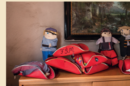
108 AUSFLUG ZU DEN PASTAFARIS Kaum zu glauben: Kirche des Fliegenden Spaghettimonsters