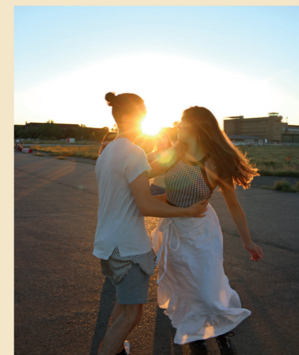
6 LIEBLINGS-SOMMER-ERLEBNISSE Zum Beispiel Flamenco-Tanzen auf dem Tempelhofer Feld