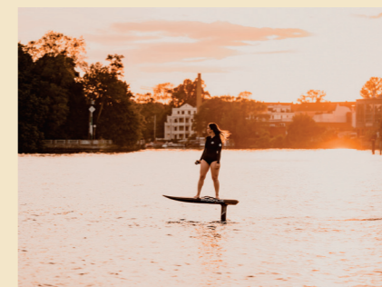
64 TRENDSPORT FOILING In Berlin sind die Wasserflächen jetzt zum Abheben. Wir verraten, wo