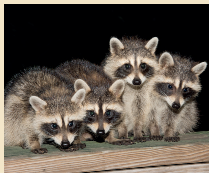
34 NACHTTIERE Wo Waschbären wunderbar wild balgen – nach Sonnenuntergang