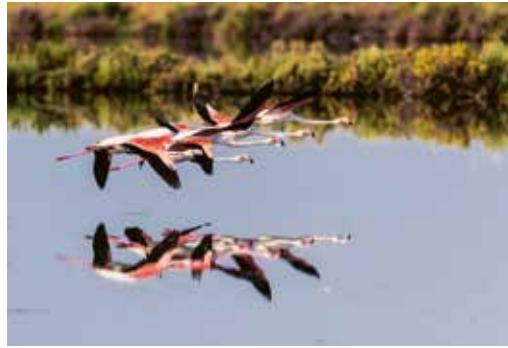
Flamingos im Po-Delta (Isola di Albarella)