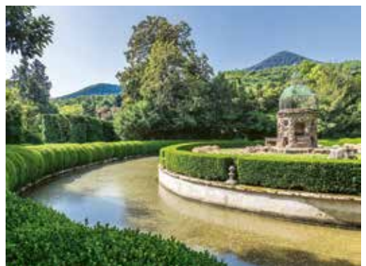
Labyrinth im Giardino di Valsanzibio (siehe S. 83)

Ohne Zeitdruck durch Venetien zu reisen und viele neue Eindrücke zu gewinnen, ist einfach herrlich.