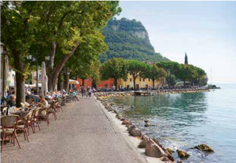
Garda, einer meiner Lieblingsorte am Lago