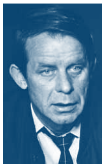
Siegfried Lenz